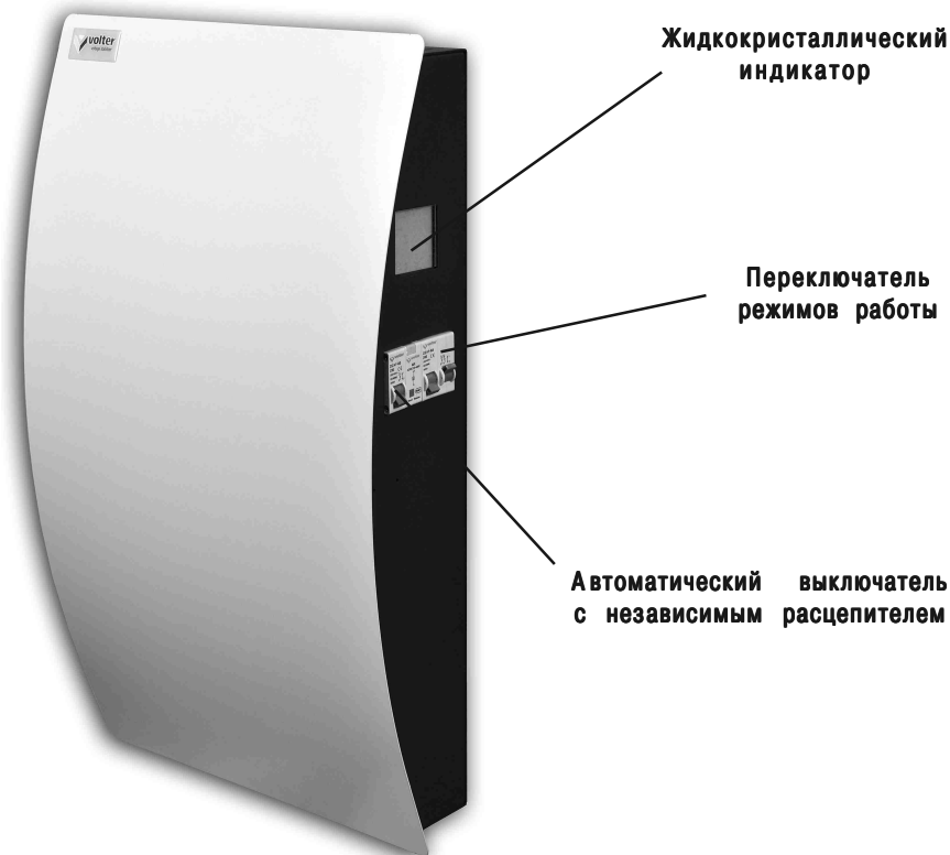
Рис. 1. Стабилизатор напряжения

В верхней части расположен клеммник, для подключения стабилизатора, закрытый крышкой. Там же расположен заземляющий контакт.