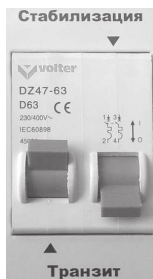
Рис.8. Режим «Транзит»