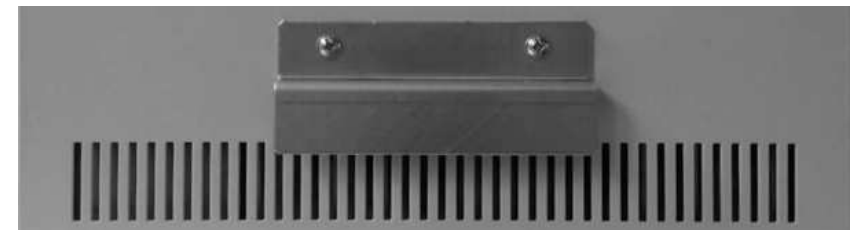
Рис. 3 Упорная планка