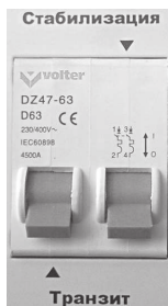
Рис.7. Отключены оба режима.

При неисправностях стабилизатора необходимо обращаться в сервисный центр, так как стабилизатор не рассчитан на самостоятельный ремонт пользователем.