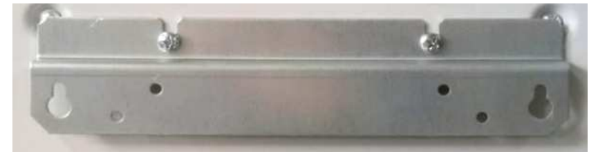
Рис. 2 Крепежная планка

Для размещения стабилизатора на стене сначала монтируется крепежная планка (рис.2), потом на нее подвешивается аппарат и производится подключение токоведущих проводников. Упорная планка на стабилизатор установлена с завода (рис.3).