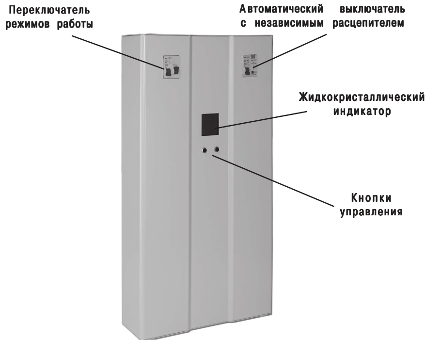
Рис. 1. Стабилизатор напряжения Etalon-S

В верхней части расположен клеммник, для подключения стабилизатора, закрытый крышкой. Там же расположен заземляющий контакт.