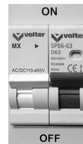
Рис.6. Автоматический выключатель