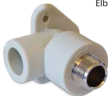
Elbow MT with wall hanger Wandscheibe mit Aussengewinde