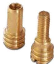
Bolts for heating endings Montageschrauben