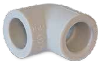
Elbow 90° Winkel 90°