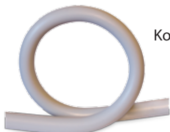
Compensating loop PN20 Kompensationsschlinge PN20