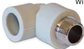
Elbow MT Winkel mit Aussengewinde