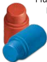
Plug for pressure tests, red / blue Bauabdruckstopfen, rot / blau