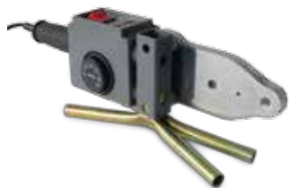
Welding device Handschweissgerät