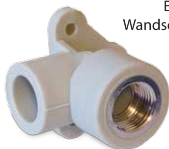
Elbow FT with wall hanger Wandscheibe mit Innengewinde