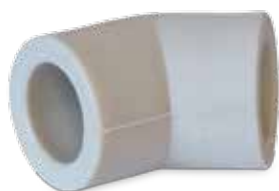
Elbow 45° Winkel 45°