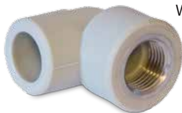
Elbow FT Winkel mit Innengewinde