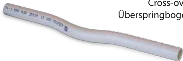
Cross-over PN20 Überspringbogen PN20