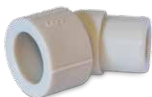
Elbow 45° female / male Winkel 45° innen aussen