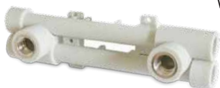
Wall mounting set Montagegruppe