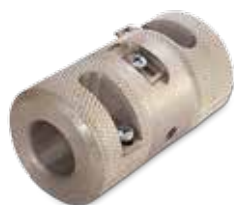
Peeling tool for stabi pipe Schälwerkzeug für Stabi - Verbundrohr