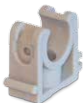
Pipe clamp single Rohrschelle