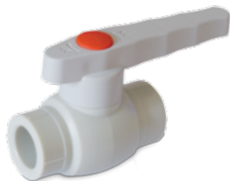
PP-R ball valve Kugelhahn