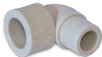
Elbow 90° female / male Winkel 90° innen aussen