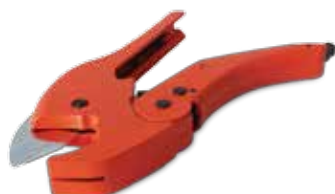
Pipe shears Kunststoffrohr - Schere