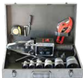
Welding set Montagesatz