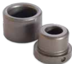
Heating endings Schweisswerkzeuge Buchse + Dorn