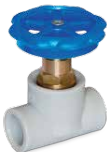
PP-R stop valve Geradsitzventil