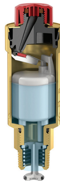
Flexvent: воздушный клапан открыт.