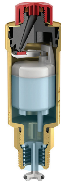
Flexvent: воздушный клапан закрыт.