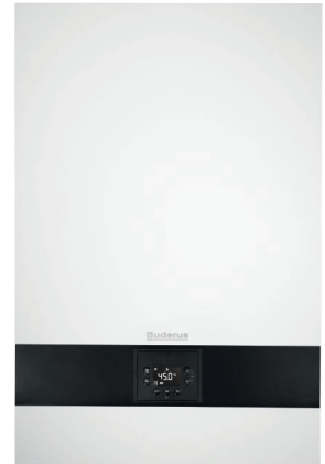
Logamax plus GB172i T50

Вбудований бак гарячої води з нержавіючої сталі забезпечує продуктивність до 16,8 л/хв - це суттєво більше, ніж у двоконтурного котла. Висока швидкість